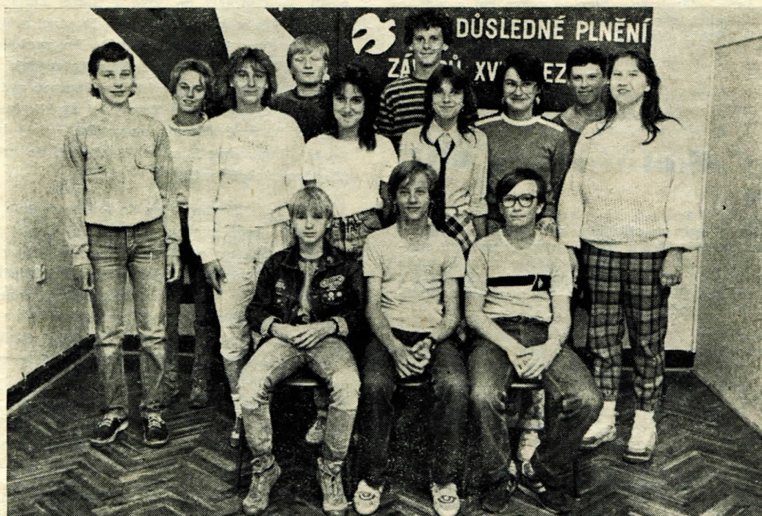
Beseda SPOZ s žáky končícími 8. ročník ZŠ